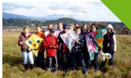
Piatacké šarkany leteli vysokóóó