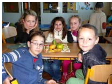
V ŠKD deň ovocia a zeleniny. Doprajme si vitamíny