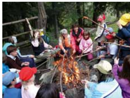
Turistika. Cestou na Žiarsku chatu sme sa posilnili a zohriali