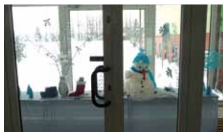
„Konečne napadalo snehu aj na školskom dvore!“ potešil sa snehuliak vo vestibule školy