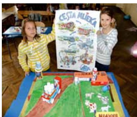
Deň mlieka na prvom stupni. Žiaci v projekte sledovali mliečnu cestu, ale tú vesmírnu

sú starší. Na stretnutiach po rokoch sa bývalí žiaci priznajú: „Škoda pani učiteľka, že som vás viac nepočúval, mal som sa lepšie učiť, nebol by som