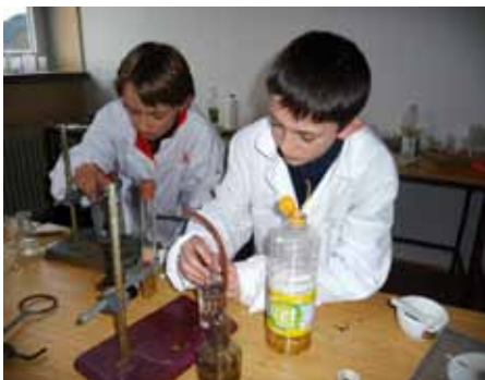
Na chemickom krúžku: Ocot a škrupiny nám robia bubliny

Stáva sa, aj keď nie často, že sa niektorým žiakom nechce vstávať a ísť do školy. Nečudujeme sa maličkým škôlkárom keď plačú, ťažko sa im lúči s mamou, či otcom. Postupne si zvyknú, nájdu si kamarátov, obľúbia pani učiteľku. Po príchode do 1. triedy by sa chceli hrať dlhšie, pýtajú sa pani učiteľky, prečo nemôžu na školskom dvore po veľkej prestávke zostať vonku tak dlho ako v škôlke. Postupne, ako sa šplhajú do vyšších ročníkov, hľadajú odpovede na iné otázky: „Prečo sa musia učiť naspamäť báseň, ktorá im veľmi ťažko ide do hlavy, načo im bude v živote Pytagorova veta, načo sa mám učiť o bitke na Bielej hore, keď chcem ísť na elektrotechnickú školu, načo mne bude angličtina, keď budem variť v kuchyni...?“ Všetci by sme im vedeli odpovedať prečo, ale presvedčiť ich, že sa učia v živote pre seba a že okrem vedomostí a zručností dostanú v škole oveľa viac, to mnohí pochopia až keď